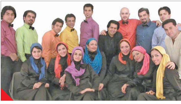
اشی‌مشی و دو قطعه خارجی روی صحنه بردیم. البته یک کنسرت کوتاه ۲۰ دقیقه‌ای هم برگزار کردیم.