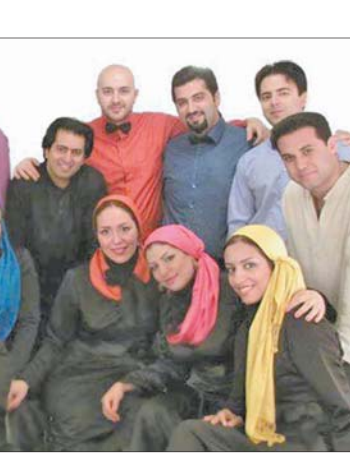
کمتز اتفاق می‌افتد دآوری به گروه‌ها تبریک بگوید و حتی بخواهد با آن گروه عکس بگیرد.

یکی از دلایل آن به وقفه سه ساله ما برمی‌گردد. ما از سال ۱۳۹۰ به دلایل اقتصادی در جشنواره‌های خارجی حضور نداشتیم اما دلیل دیگری این‌س است که این رویداد یکی از معتبرترین جشنواره‌های کر در جهان است که به‌صورت دوساله در کشورهای مختلف برگزار می‌شود. در دوره قبل در این جشنواره که در چین برگزار شد، یک مدال نقره و دو مدال برنز به دست آوردیم اما کسب مدال طلا و نقره در این دوره پیشرفت بسیار بزرگی برایمان محسوب می‌شود. بعضی از اعضای هیئت داوران که به دورهای قبل کارهای ما را شنیده بودند، اینبار به این نکته اشاره کردند که پیشرفت زیادی کرده‌اند و به همین دلیل موفقیت اصلی ما در کسب مدال نبود بلکه می‌توان گفت در همین پیشرفت و دیده‌شدن بود. وقتی در بخش گروه کر زیر ۳۰ نفر mix chamber choir اجرایمان را انجام دادیم تعدادی از داوران به ما تبریک گفتند در حالی که